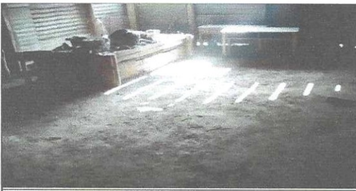
foto 5. Mejoramiento de polleton de cocina.