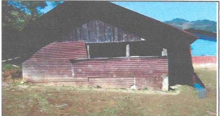
foto 4. Rehabilitación y mantenimiento de paredes.