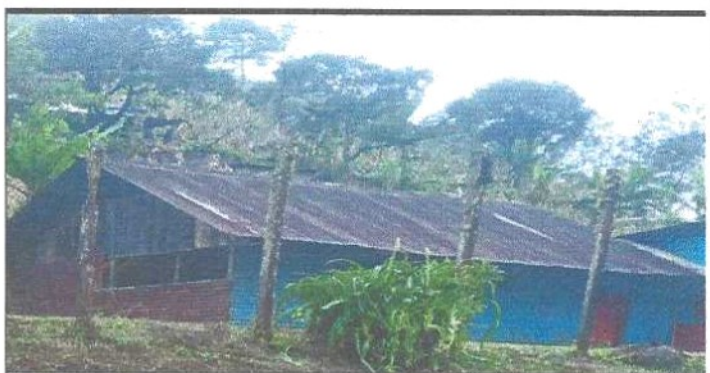
foto 6. Sustitución de lamina en mal estado.

Observación: Si es necesario se pueden agregar hojas adicionales y actualizar el número de hojas.