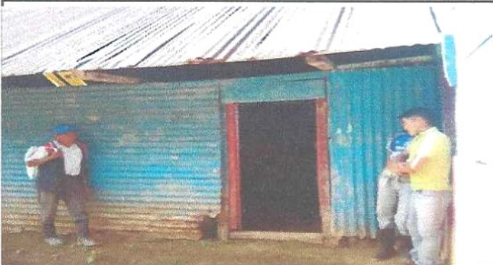
foto 3. Sustitución de puerta.