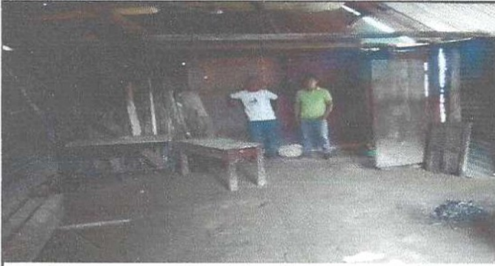
foto1. Sustitución a torta de cemento.